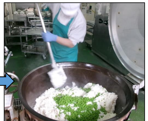
ごはんにもぜます