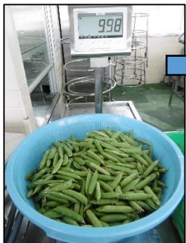
グリーンピース 約10kg!